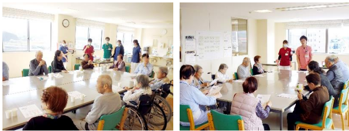
心臓リハビリ教室